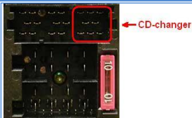
Рис.2.2. Разъем магнитолы (тип А, 8-pin Mini-ISO)

Интерфейсные адаптеры VW_Touareg-MB (рис.1) и VAG-MB предназначены для подключения к штатным магнитолам AUDI, VW, Skoda, Seat, которые умеют управлять внешним штатным CD-чейнджером и имеют для этого соответствующий интерфейс и разъем (рис.2.1 и рис.2.2 соответственно).