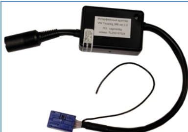
Рис.1. Адаптер VW_Touareg -MB